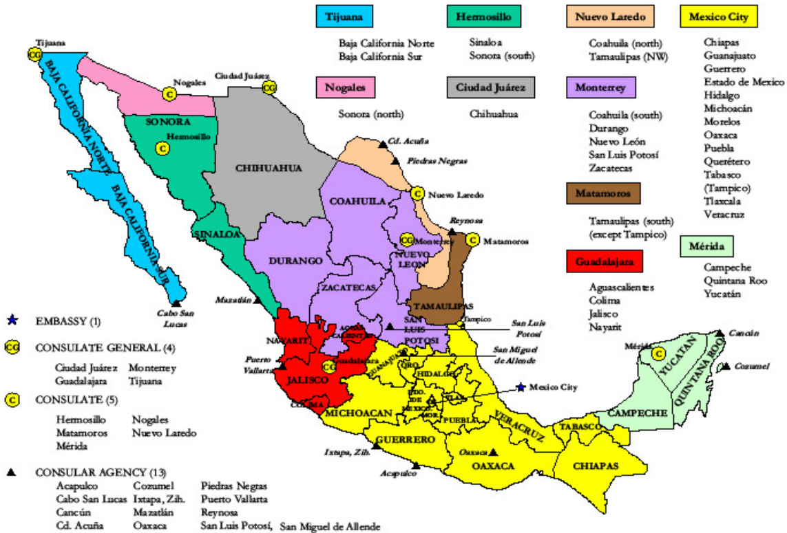
Map from website of U.S. Embassy in Mexico